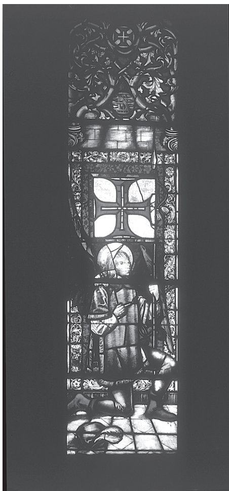
Fig. 4 – Anjo de Portugal, 1514.

Por cima dos retratos régios, veem-se, à esquerda, um anjo empunhando o estandarte da Ordem de Cristo (fig. 4) e, à direita, um guerreiro com o da esfera armilar (fig. 5), símbolos consagrados da heráldica manuelina. Eis uma escolha idêntica à da fachada ocidental da igreja do Convento de Cristo, encomenda manuelina poucos anos anterior à da Batalha, em que, nas mesmas posições relativas, aparecem anjos e reis de armas, associados ao lado divino e o lado terreal da realeza. O anjo da Batalha é particularmente interessante no seu traje de pajem. Deste vitral fazem parte, não por acaso, duas peças pintadas com o escudo dominicano e a data de 1514.