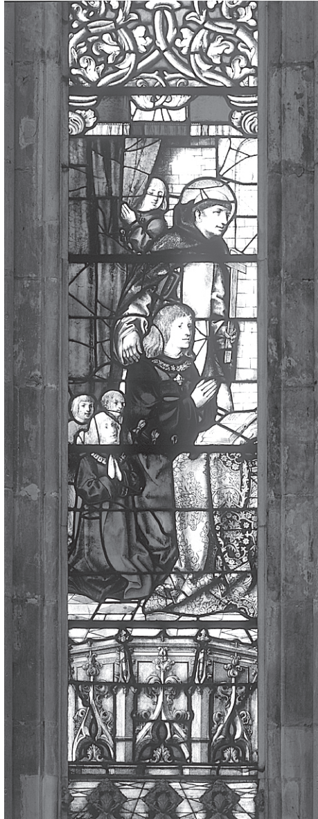
Fig. 2 – Retrato de D. Manuel I, segunda década do século XVI.

O conjunto da capela-mor foi encomendado pelo rei D. Manuel, o que é atestado pela presença do seu retrato enquanto doador, em baixo à esquerda, e confirmado pela presença da data de 1514 no vitral do Anjo de Portugal. A mesma data está associada ao conjunto da casa capitular, cuja execução data desse ano. No entanto, a obra da capela-mor arrastou-se por mais de década e meia devido a percalços que serão referidos mais adiante. Por esse motivo, a obra não foi executada