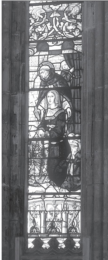
Fig. 3 – Retrato de D. Maria, segunda década do século XVI.

proteção de S. Pedro Mártir, identificável por um golpe na cabeça. A presença dos santos constitui uma exceção à regra que coloca junto dos doadores os respetivos santos protetores, conforme se podem ver no portal axial da igreja do Mosteiro dos Jerónimos – S. Jerónimo com D. Manuel e S. João Batista