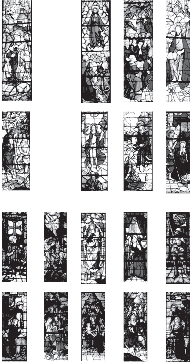
Fig. 6 – Proposta de colocação primitiva dos vitrais da capela-mor conservados. Está ausente a linha de baixo do andar superior (terceira a contar do topo) por se ter perdido.

(Continua no próximo volume, que incluirá a Bibliografia)