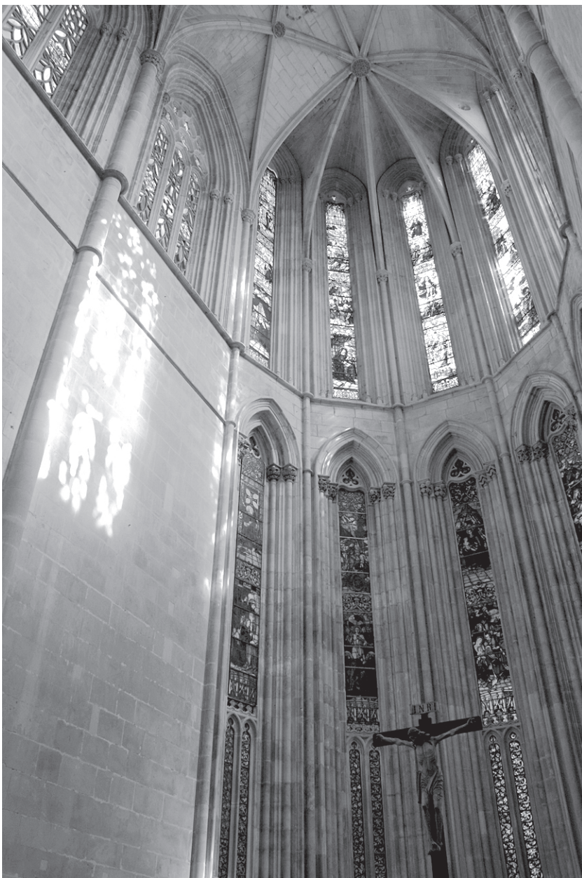
Vista geral da capela-mor da igreja do Mosteiro da Batalha