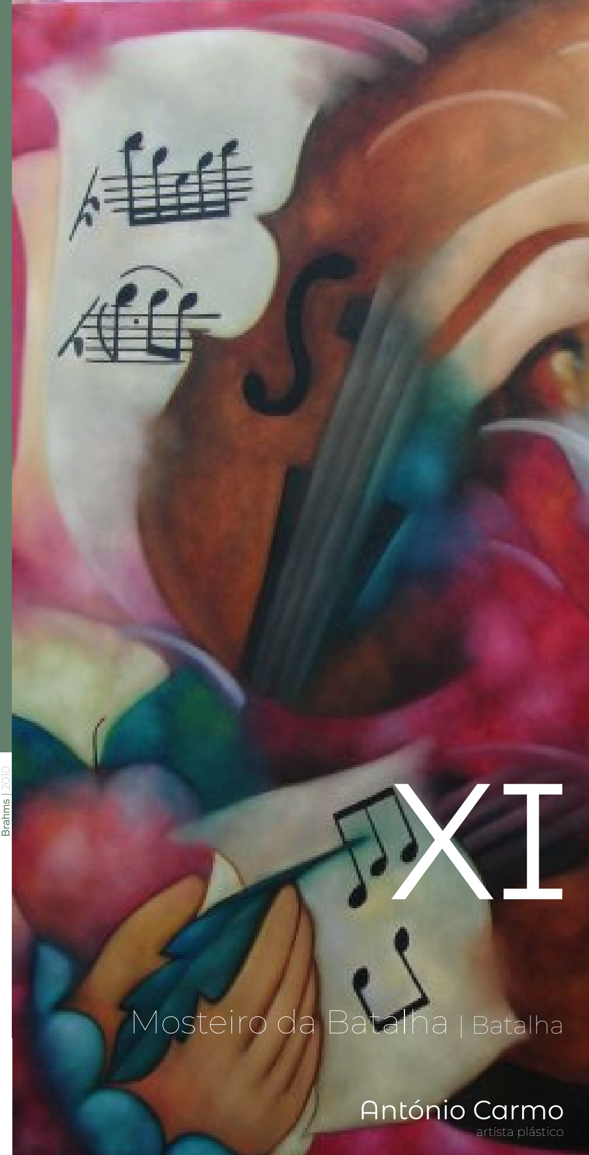
António Victorino d'Almeida Maestro