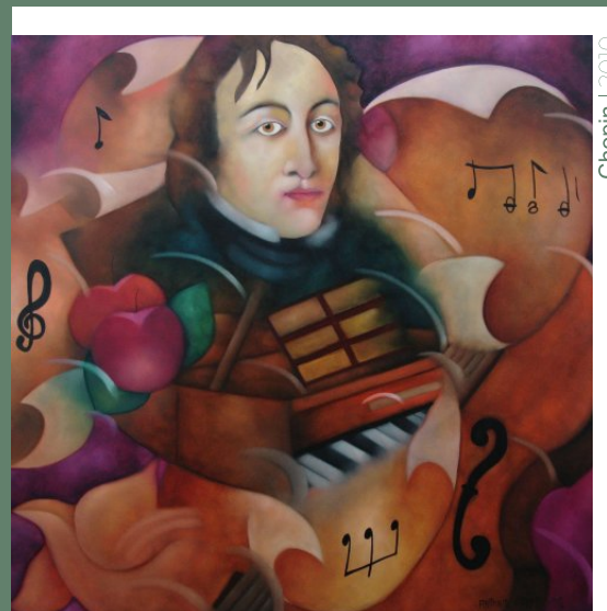
Chopin | 2010