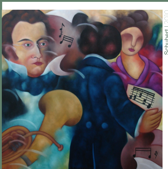
Schubert | 2010

Não posso deixar por último de salientar o orgulho que para mim representa figurar nesta colectânea, prova igualmente inequívoca da velha amizade que me liga ao pintor.